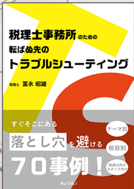
税理士事務所のための転ばぬ先のトラブルシューティング (株式会社ぎょうせい/富永昭雄氏)

「トラブルの一手手前で気づきミスを事前に回避する」という冷や汗をかく事態は、税理士事務所の中では日常茶飯事です。「簡単なことなのに…」後から振り返れば、知識としては難しいことではないのに、なぜか日常の税実務ではトラブルが起こってしまう…。それを防止するには、トラブル事例を数多く見ておくことです。ここに落とし穴が潜んでいるかもしれないと想像できるように、できるだけ多くの事例をご紹介します。